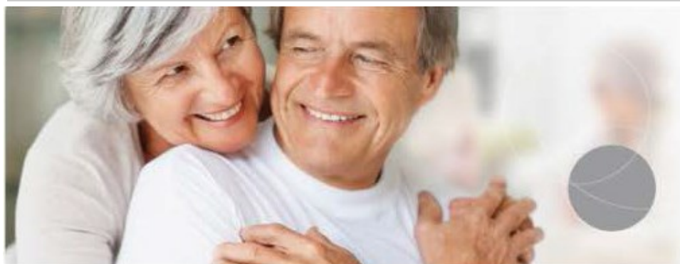
Table régionale de concertation des aînés de Laval